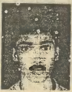
മുജാഹിദ് മുജാഹിദ് വിഭാഗം രണ്ടുപേരുടെ ജഡങ്ങൾ കിട്ടി. ഇതിനെ ഭേദിക്കുന്നതായിരുന്നു തുരുതുരാവന്നു കൊണ്ടിരുന്ന കല്ലേർ. അടുത്തുള്ള പള്ളിയിൽ സംഘടിച്ച് സുന്നി പ്രവർത്തകർ ആക്രമണം നേരത്തെ തീരുമാനിച്ചുറച്ചതായിരുന്നു വെന്നതിന് കൂടുതൽ തെളിവുകളൊന്നും ആവശ്യമില്ല. സാഗത